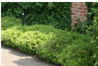
Buxus microphylla 'rococo'

Espèces qui conviendraient pour les zones de plantations basses devant le cimetière structurant la zone de parking – renseignements fournis à toutes fins utiles et à titre indicatif.