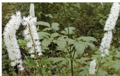
Aruncus dioicus (fleurit en octobre-décembre).