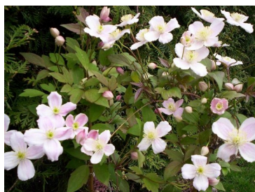
Clematis montana 'superba'