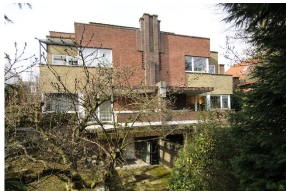
Façade avant du bâtiment, côté avenue du Parc de Woluwe. A gauche : élévation d'origine (avril 1927) – à droite : La partie de la maison concernée par la demande se trouve à gauche sur la photo.

Cette double maison jumelle se dresse au sommet d'une colline, face aux bâtiments de l'athénée royal d'Auderghem, entre l'avenue du Parc de la Woluwe en bas (ancien accès à la maison qui y dresse sa « façade avant historique », mais dont le numéro de police à rue n'est plus officiel) et la drève Louisa Chaudoir en haut du terrain, qui est l'adresse actuelle avec le numéro de police officiel, mais qui est historiquement la façade arrière.