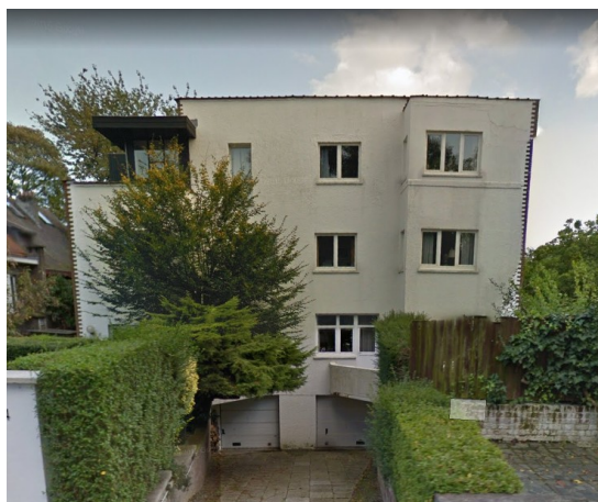
Façade arrière du bâtiment, côté drève Louisa Chaudoir

A gauche : élévation d'origine (avril 1927) – à droite : photo Google streetview (octobre 2014) La partie de la maison concernée par cette demande d'avis de principe se trouve à droite sur la photo.