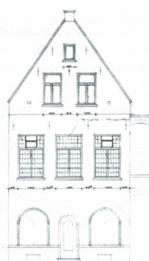
voorgevel : bestaand