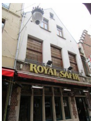
Etat existant

Le dossier concerne une maison traditionnelle datant du XVII e siècle et maintes fois transformée, notamment dans les années 1970 lorsque la façade a adopté son aspect actuel. Le bien est compris dans la zone de protection de l'impasse Schuddeveld et du Théâtre Toone ainsi que dans la zone tampon Unesco, définie autour de la Grand-Place reconnue comme Patrimoine mondial.