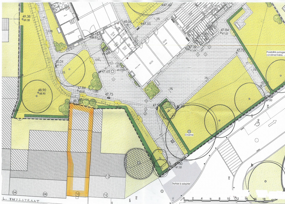
Fragment van het aanlegplan van het park van de Thielemanshoeve (vergunning 19/PFU/496049)

Aangezien de heraanleg van het park momenteel in uitvoering is (vergunning 19/PFU/496049 van 28/08/2015), vraagt de KCML de Gemeente om naar aanleiding van de voorliggende aanvraag, de aanleg ter hoogte van de bedoelde gemene muur te verbeteren. Tot voor kort was de deur bereikbaar via een pad dat volgens het vergunde plan (zie het fragment hierboven) vervangen zou worden door enkele traptreden. De Commissie vraagt hier een continu talud met beplanting te voorzien alsook de muur en de deur aan het gezicht te onttrekken met klimplanten.