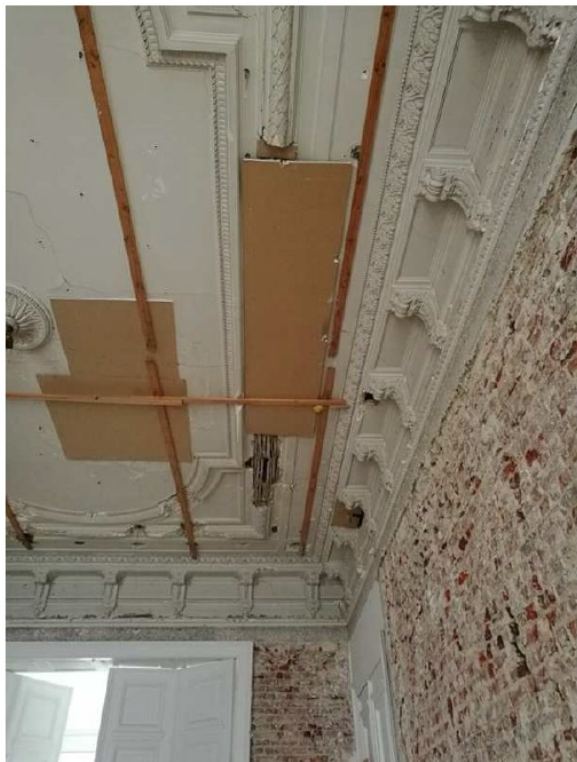
Fig. 3. Quelques vues intérieures de l'Hôtel Peltzer. De gauche à droite et de haut en bas : le passage carrossable, un double châssis, la cage d'escalier monumentale, un plafond mouluré du 1 er étage.