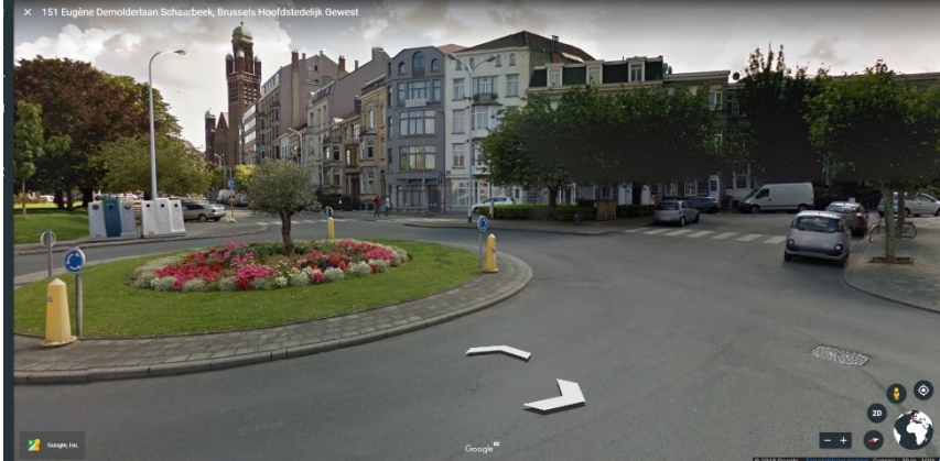
Masse végétale vouée à disparaître dans le projet

Pour ce qui concerne l'espace partagé prévu à l'entrée de la rue N. de Tière, la Commission demande de conserver les deux prunus existants et de les intégrer à la future zone de repos. Ces arbres sont plantés dans la continuité des alignements apparus depuis le Seconde Guerre et forment avec ceux-ci un ensemble visuel cohérent, surtout en saison de floraison. Les prunus constituent une masse végétale significative que l'on doit à tout prix conserver, d'autant que les futurs travaux de métro auront un impact non négligeable sur la masse végétale qui marque l'axe du square.