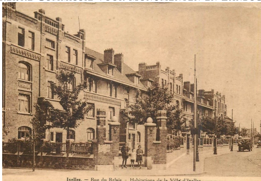
Carte postale ancienne non datée (circa 1930)

Les immeubles de l'ancienne cité ouvrière sont devancés de jardinets clos par un muret. Une entrée individuelle par parcelle donne accès aux appartements (cages d'escaliers communes) depuis le trottoir. Devenue plaine de jeux, une large parcelle dans l'intérieur d'îlot compris entre les rues du Relais et Victor Semet semble avoir été dès l'origine dévolue à un jardin commun (plus particulièrement un séchoir).