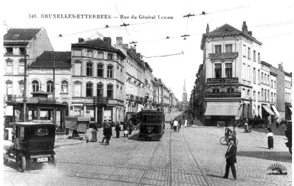
348. BRUXELLES-ETTERBEEK - Rue du Général Leman