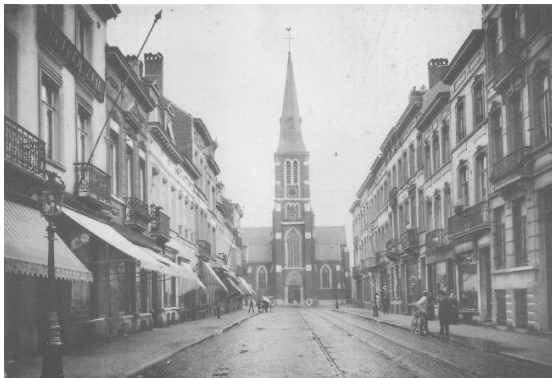
De neogotische Sint-Gertrudiskerk, als perspectiefinder van de Renteniersstraat

Inplanting van de oude en de grotere nieuwe kerk, opgetrokken in de as van de Renteniersstraat - Document