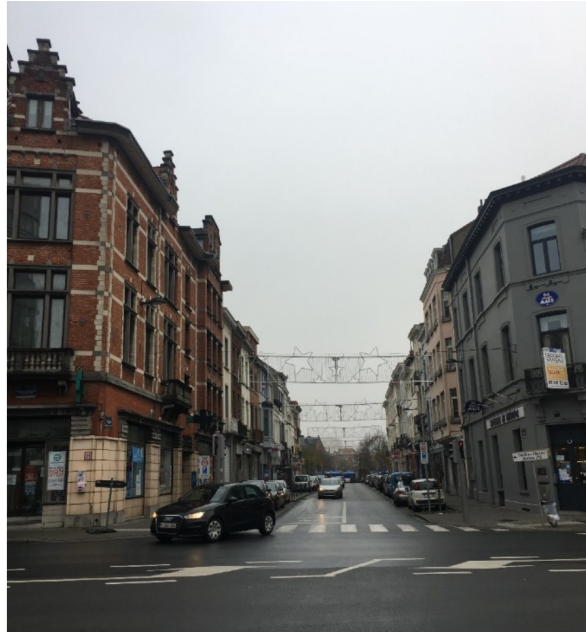
Zicht op het Van Meyelplein – bestaande toestand