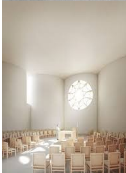
Ontwerp west- en oostgevel en centrale gebedsruimte