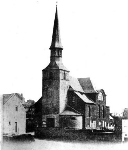
Pl. 1 - Ancienne église St e Gertrude - Etterbeek, le

Kerk uit 1750, gesloopt na de inwijding van de nieuwe kerk in 1885