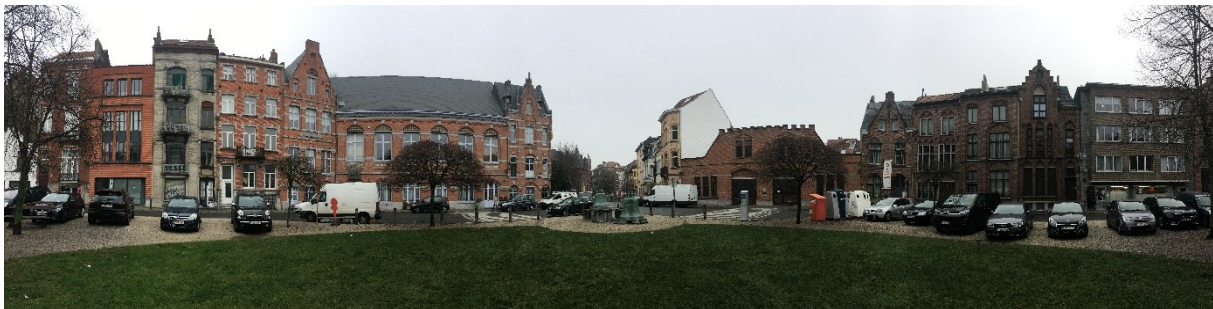
Van Meyelplein

In 1993 werd de Sint-Gertrudiskerk wegens instortingsgevaar gesloopt op last van de burgemeester en werd het Van Meyelplein heraangelegd. Thans is de openbare ruimte beplant en bevat ze onder meer de klokken van de verdwenen kerk en het herdenkingsmonument van de Armeense Genocide (1915-2015). Ondanks verscheidene projecten, werd de kerk nooit heropgebouwd.