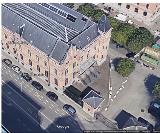
Terrasse-perron est et pavillon d'entrée