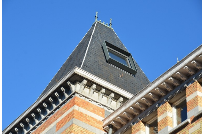
Exutoire de fumée