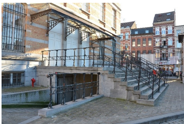
Terrasse-perron ouest