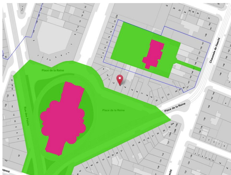
Place de la Reine (biens et sites classés, zones de protection)

Situés au chevet de l'église royale Sainte-Marie (classée comme monument par AR 09/11/1976), les trois maisons dont il est question bordent la place de la Reine, dont l'ensemble formé par l'église Sainte-Marie et ses abords est classé comme site (AR du 03/10/1983). Ces maisons se situent également en bordure de la Maison des Arts (ancien château Eenens-Terlinden), classée comme monument (façades, toitures et certaines parties intérieures) et comme site (jardin) par AG du 09/11/1993.