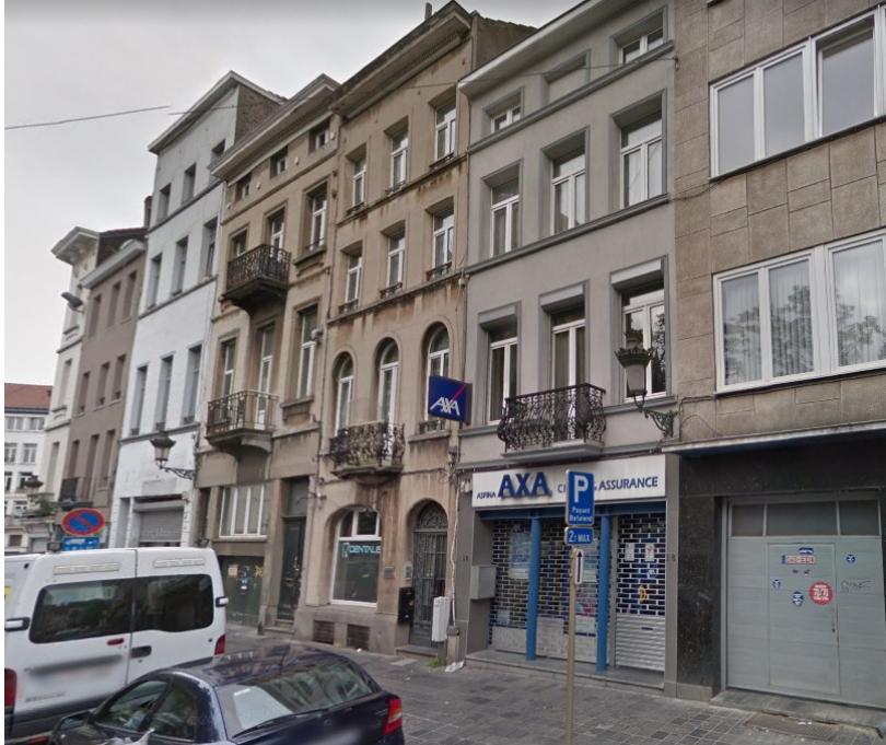
Enfilade des n os 12 à 17-18