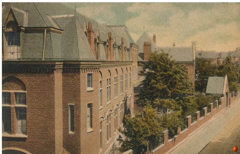
Carte postale ancienne

L'actuelle demande précise que la partie du mur autour de l'angle des rues Moris et d'Irlande sera reconstruite à l'identique et que les autres parties du mur seront remplacées par une composition analogue à celle du mur de clôture à gauche de l'entrée principale de l'Institut (n°19 rue Moris), c'est-à-dire un soubassement de pierres bleues surmonté d'un muret en briques rouges et d'une grille en fer forgé, pour obtenir un ensemble reconstruit uniforme et cohérent.