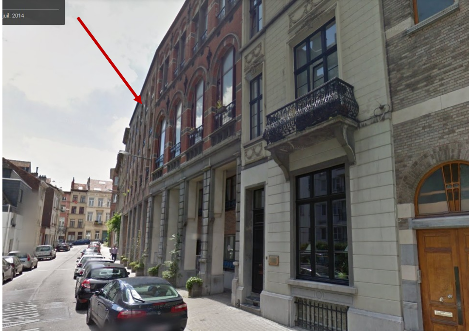
Rue du Vallon, 12-18