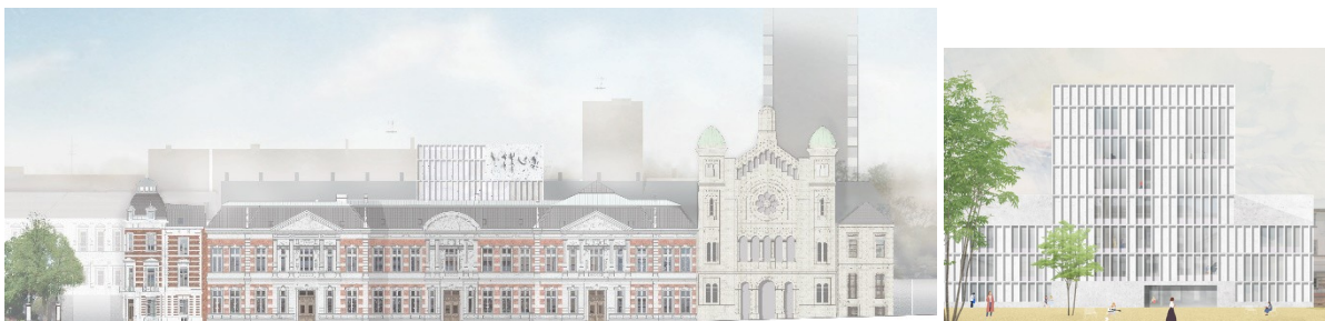
Vue sur la nouvelle tour en façade à rue et en intérieur d'îlot – extrait du dossier

Il est nécessaire de proposer un dialogue clair, juste et harmonieux entre l'ancien et le nouveau bâtiment. Dans l'état actuel du dossier ce n'est pas le cas. Le nouveau bâtiment est accolé à l'arrière du bâtiment Cluysenaar sur la quasi-totalité de la longueur et de la hauteur de la façade. Cette intervention rend aveugle la quasi-totalité du couloir du bâtiment Cluysenaar et certains locaux du nouveau bâtiment, ce qui est dommageable tant pour le patrimoine que pour l'intervention contemporaine. Mis à part l'escalier menant au grand jardin en pleine terre, aucune connexion de qualité entre l'ancien et le nouveau n'est réalisée. L'escalier monumental créé pour réaliser la connexion entre les différents éléments demeure anecdotique ; il ne couvre qu'un seul niveau et n'assure pas une connexion verticale lisible, fluide et monumentale avec le reste des étages.