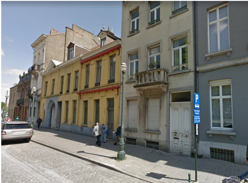
Quai à la Chaux, n os 3 à 6