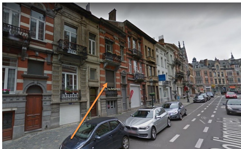
Voorwerp van de aanvraag

De aanvraag betreft een eengezinswoning in eclectische stijl gelegen aan het Colignonplein 36, tegenover de zijgevel van het als monument beschermde Gemeentehuis, en opgenomen in de vrijwaringszone ervan. Het pand behoort tot een homogeen gevelfront dat bestaat uit een geheel van negen huizen, die in 1897 ontworpen werden in opdracht van eenzelfde eigenaar (de nummers 32 t.e.m. 48).