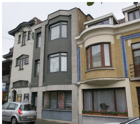
Fig. 2. Vue de la façade à rue après travaux.

D'un point de vue strictement patrimonial et de l'impact sur la zone de protection, la CRMS est défavorable au traitement chromatique de la façade à rue dont la couleur très foncée introduit un contraste malheureux qui porte préjudice à la mise en valeur du patrimoine, que ce soit au niveau du front bâti de l'avenue Broustin ou du bien classé sis au n° 110.