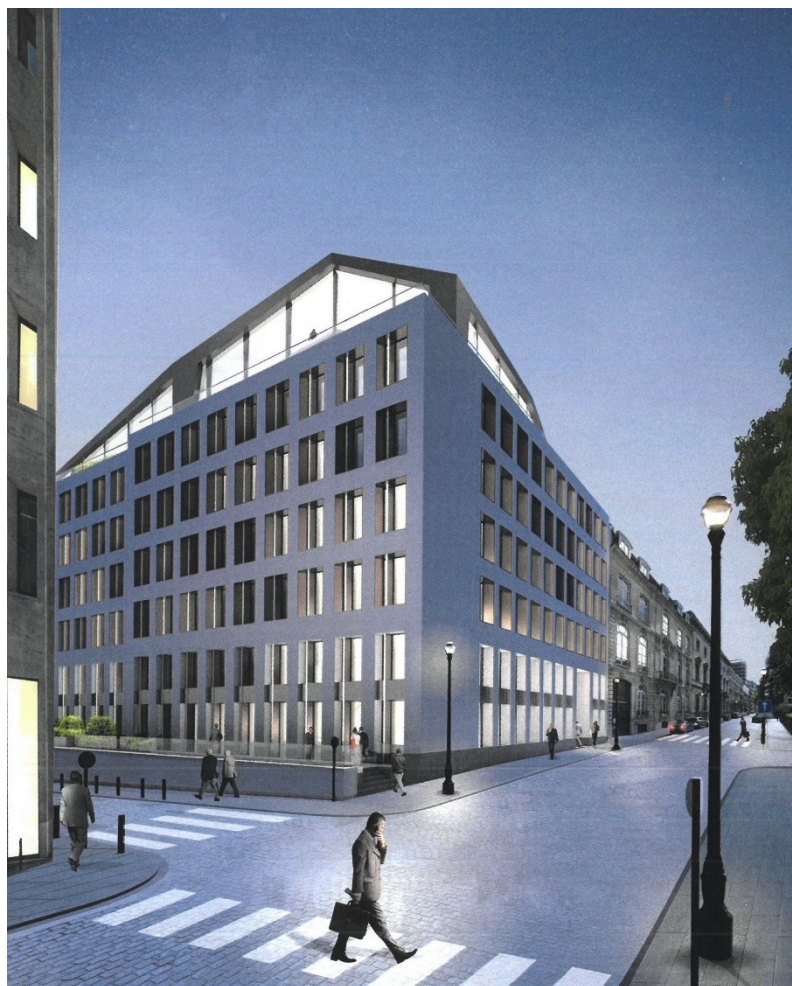
Photomontage des aménagements projetés. Vue depuis l'angle rue de la Science / rue Jacques de Lalaing. Photomontage tiré du dossier.