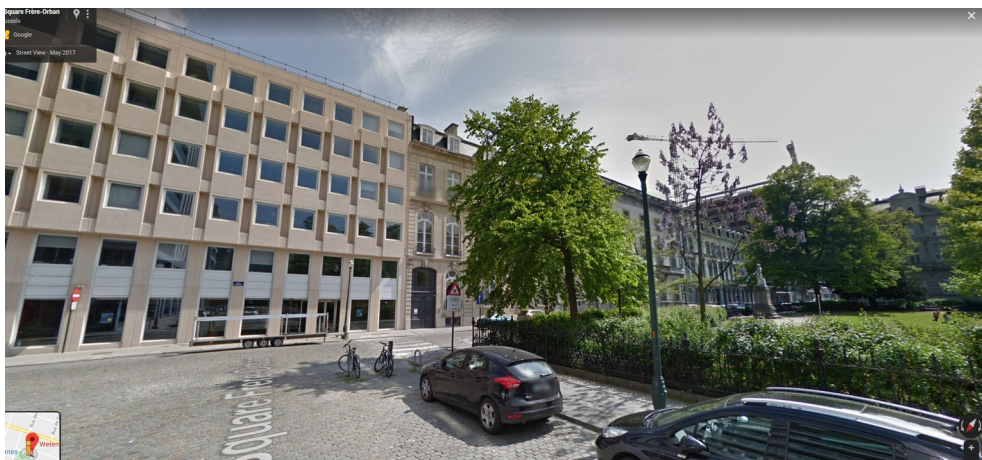
Vue de la façade rue de la Science

Ce bâtiment d'angle affiche deux longues façades animées de ressauts, s'étageant sur 6 niveaux hors-sol. De nombreux parkings souterrains accompagnent l'édifice.