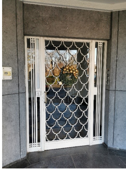
Fig. 3. Vue de la porte d'entrée de l'immeuble "Le Tonneau".

COMMISSION ROYALE DES MONUMENTS ET DES SITES KONINKLIJKE COMMISSIE VOOR MONUMENTEN EN LANDSCHAPPEN tout en bénéficiant de plus de place que s'il est placé à l'extérieur, et peindre l'ensemble dans la teinte foncée d'origine (à déterminer par stratigraphie).