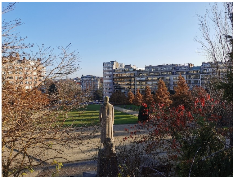
Fig. 2. Vue de l'immeuble "Le Tonneau" depuis le jardin du Roi.