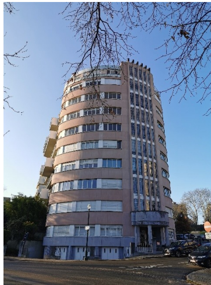
Fig. 4. Vue de la travée principale de l'immeuble "Le Tonneau". © CRMS, décembre 2019.

Enfin, l'Assemblée regrette que la remise en place de la couverture en cuivre des nervures en tôle de cuivre ne soit pas projetée dans le cadre de cette demande de permis. Elle encourage la restitution de ces éléments dans leur état d'origine car ils jouent un rôle essentiel dans la perception du monument classé et demande, dans un premier temps, de mieux documenter la remise en place future de ces tôles via des détails/photos historiques.