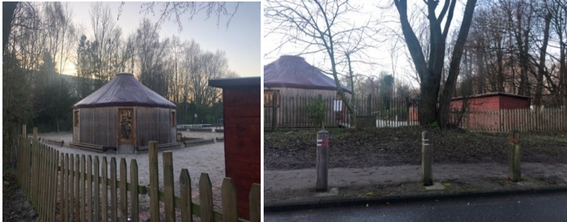
Vues da la yourte installée (©CRMS, déc. 2019)