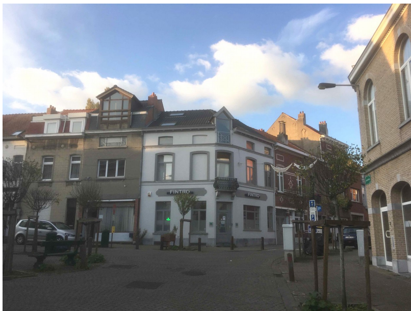
Fig. 1. Vue du bâtiment depuis la rue. Illustration issue du dossier de demande.

Élévation enduite comptant deux travées dans chacune des rues, reliées par une travée biaise. Le r.d.ch. comporte une vitrine rue René Declercq, légèrement élargie en 1929. Travée biaise marquée par un balcon à garde-corps pansu en ferronnerie et par une lucarne passante de bois, modernisée 1 .