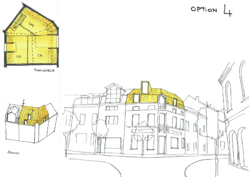
Fig. 3. Illustration issue du dossier de demande.

C'est pourquoi, parmi les options proposées, la Commission privilégierait l'option 4 car elle est la plus respectueuse des qualités patrimoniales de l'immeuble. Il conviendrait toutefois de simplifier encore le volume, de supprimer la grande lucarne projetée dans la partie supérieure gauche et d'évaluer les possibilités de suppression de la lucarne existante, quitte à en créer deux paires en alignement des baies existantes, respectivement de part et d'autre du pan coupé.