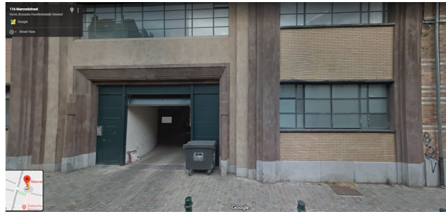
Porte existante de l'aile industrielle