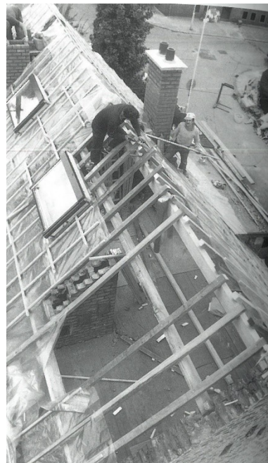
Remplacement des toitures et isolation durant les années '80.

Pour garantir la pérennité et un bon état de conservation des habitations, les toitures des différentes maisons, furent toutes renouvelées entre 1982 & 1987, les tuiles d'origine - très lourdes - de type « Pottelberg » furent remplacées par un modèle plus léger et plus aisément remplaçable. Le remplacement des tuiles fut accompagné d'une révision complète des charpentes, du placement d'un isolant de laine de verre à l'intérieur et de l'implantation d'un velux en toiture arrière.