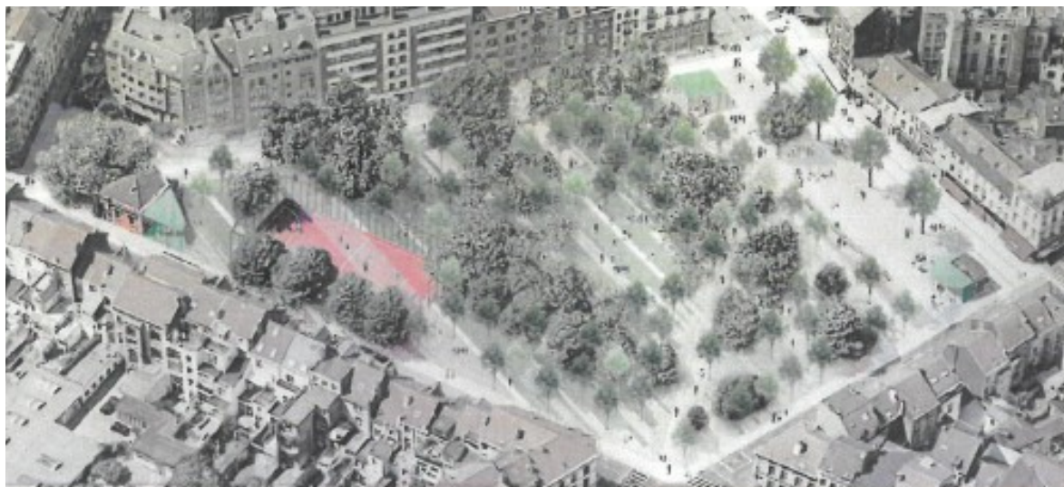
Photomontage aérien depuis l'est. Zoom sur les aménagements de la Place. Image tirée du dossier

Dans la partie sud, l'essentiel des plantations existantes est conservé et complété afin de créer une petite canopée ; dans la partie est, un pavage avec joints herbeux est prévu, tandis qu'à l'ouest est prévu un environnement engazonné doté de noues ; le tout inscrit dans un réseau de parallèles, signature du paysagiste. L'aire de sport existante est conservée, et un patio est accolé aux anciennes écuries. Un plateau traversant est créé rue de l'Hôtel des Monnaies, afin de relier la place Marie Janson au parc Pierre Paulus.