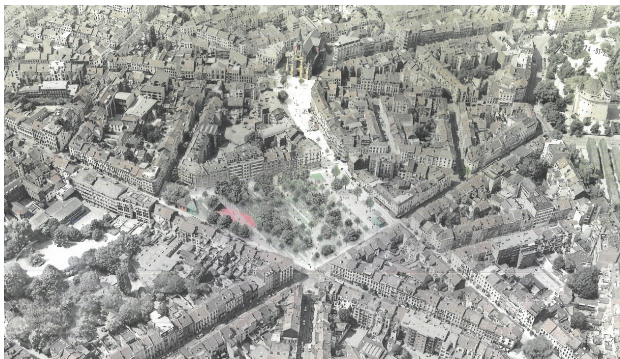
Photomontage aérien depuis l'est, des aménagements de la Place. Image tirée du dossier

L'aménagement du site s'organise autour d'une diagonale partant du carrefour Rue de la Victoire / Rue de l'Hôtel des Monnaies et aboutissant à proximité du Parvis. L'implantation d'un kiosque est prévue à cet endroit