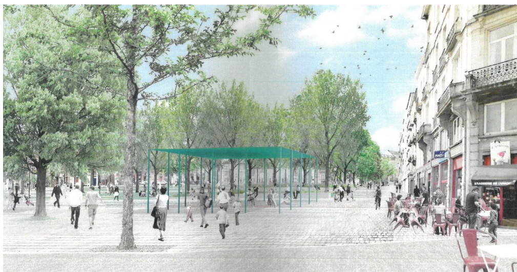
Page suivante : Photomontage des futurs aménagements, dont le kiosque, depuis l'angle avec le Parvis. Image tirée du dossier.