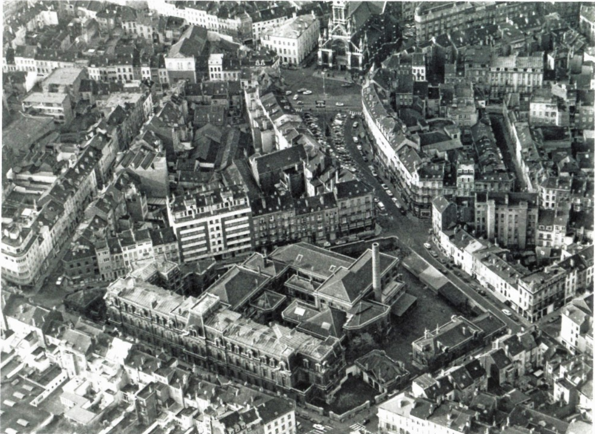
Ci-dessus : Vue aérienne de l'Hôtel des Monnaies en 1957

Le PPAS Janson approuvé, en 2013, confirme la fonction d'espace public de la quasi-totalité de l'ensemble, mais prévoyait un parking souterrain du côté de la rue de Moscou, destiné à compenser une diminution importante du stationnement en voirie. Depuis les idées ont évolué, et cette volonté de compenser la perte de stationnement perd du terrain. Le Contrat de Quartier Durable « Parvis – Morichar 2015-2019 » ne reprend plus ledit parking dans sa programmation.