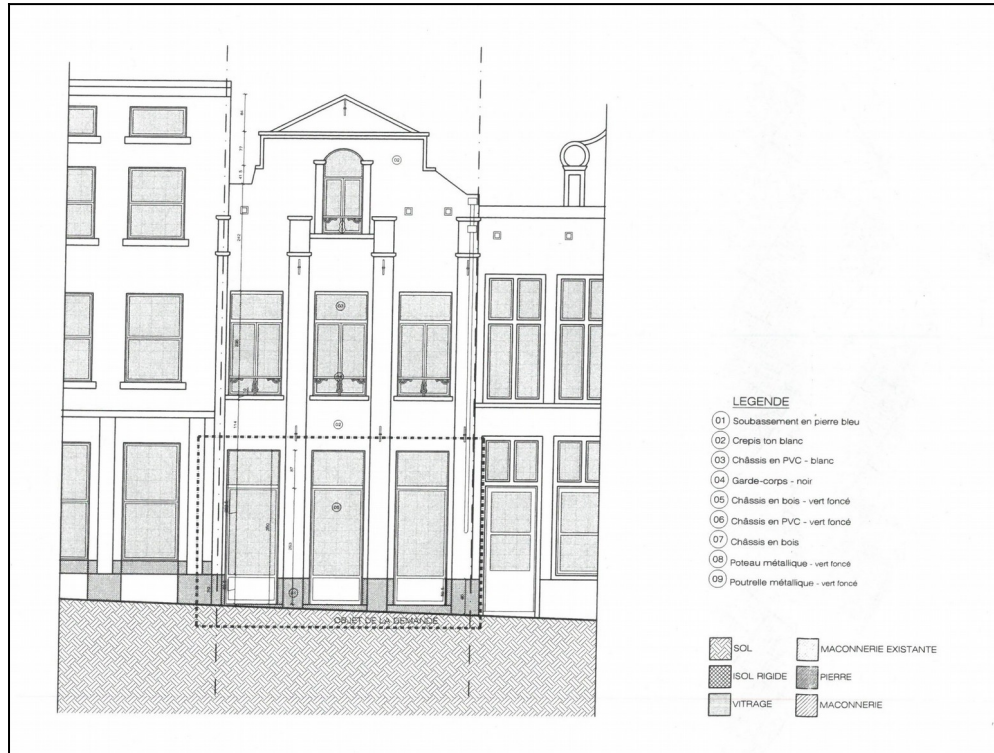
Fig. 3. Façade avant, situation projetée. Illustration issue du dossier de demande.