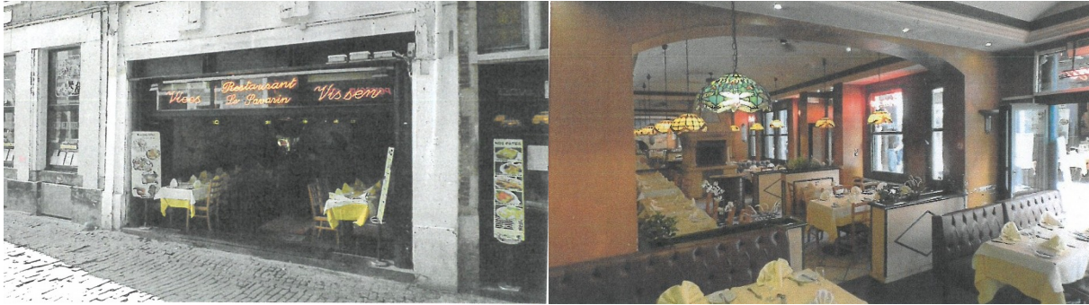
Fig. 2. Vues extérieure et intérieure du rez-de-chaussée du n° 11 rue des Bouchers. Photos issues du dossier de demande.

La présente demande, introduite en septembre 2017, vise à répondre à ces PV d'infraction. Suite au rapport de la DMS (actuelle DPC), un article 191 « Modifications mineures de la demande initiale » a été adressé aux demandeurs du permis lui demandant de modifier les plans déposés en respectant les conditions suivantes :