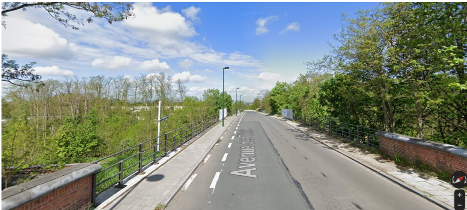
Pont 2 : avenue des Tilleuls : pont-cadre enjambant la voie de raccord L26/5 B vers la L124 (plus récent, suite à la volonté de supprimer les cisaillements) (voir dossier photos 6 à 9)