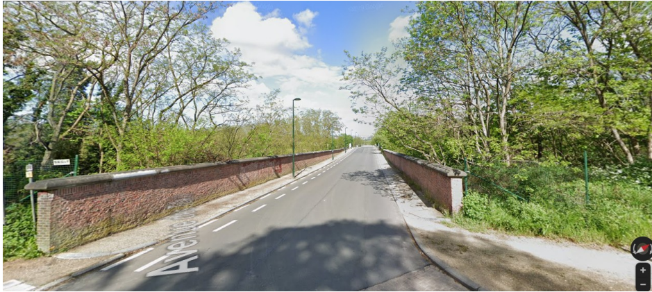
Pont 1 : avenue des Tilleuls (au croisement avec la rue du Kriekenput) : pont-arche enjambant la voie de raccord L26/5 A (voir dossier photos 12 à 16)

Les ponts concernés se situent successivement :