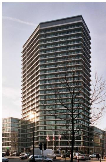
Avant-Projet aquarellé et réalisation finale.