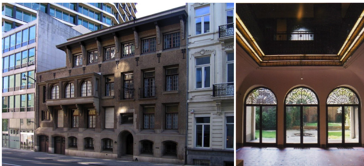
A gauche : Hôtel Wielemans mitoyen à la Tour generali.

Le fond de jardin de l'Hôtel Wielemans est, pour sa moitié droite, occupé par une annexe relevant de l'Hôtel, et pour sa moitié gauche, occupé par un mitoyen auquel s'adosse la partie à démolir pour créer le jardin. Il n'y a pas de détails disponibles concernant le raccord à l'Hôtel Wielemans et son jardin. La CRMS demande que soit envisagée une diminution de la hauteur du mitoyen avec l'Hôtel Wielemans par rapport à la situation existante ; cela constituerait une plus-value au niveau patrimonial.