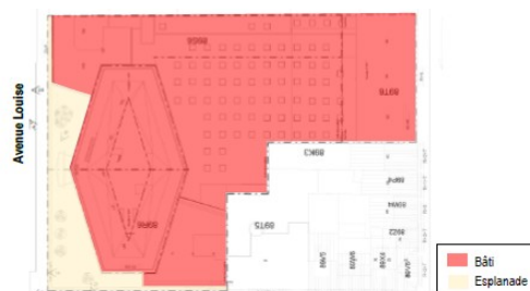
Figure 56 : Implantation du bâti en situation existante (ARIES sur fond A2RC Architects, 2019)