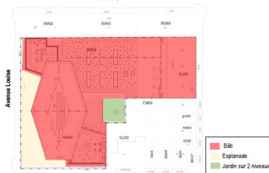
Figure 57 : Implantation du bâti en situation projetée (ARIES sur fond A2RC Architects, 2019)