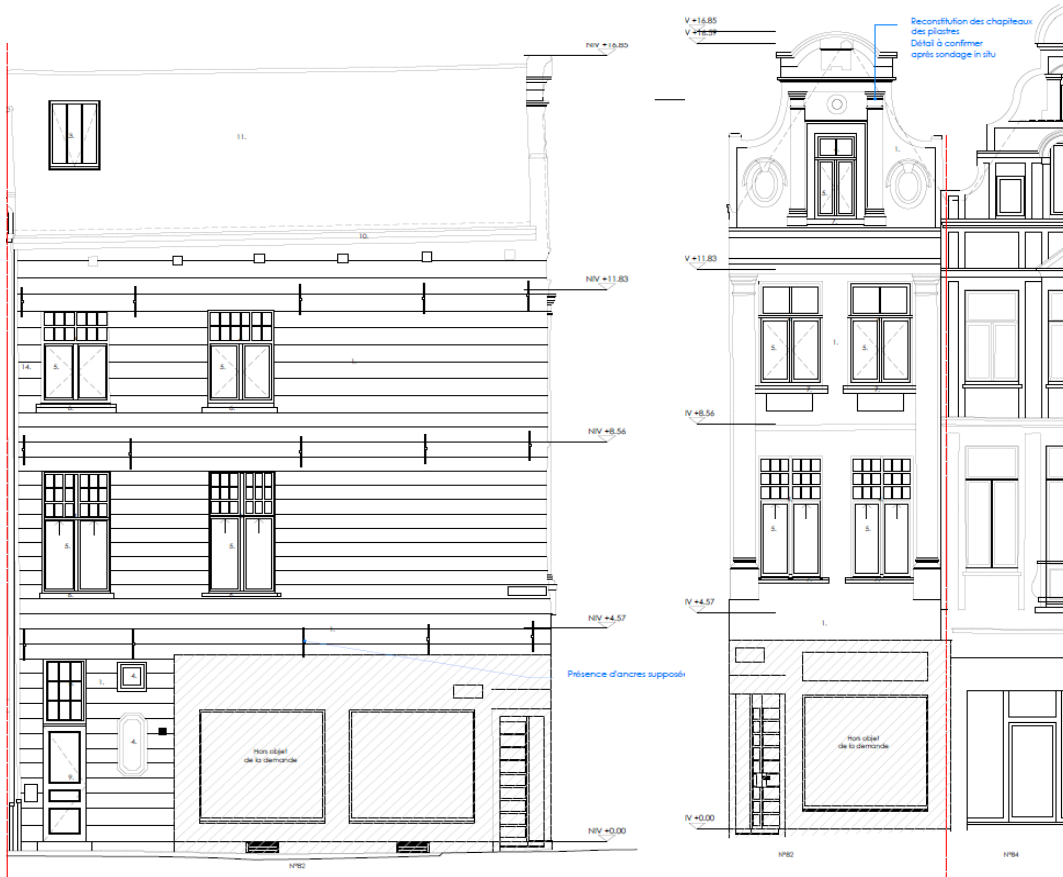
Projet façade latérale (gauche) et avant (droite) : plans de la demande de permis