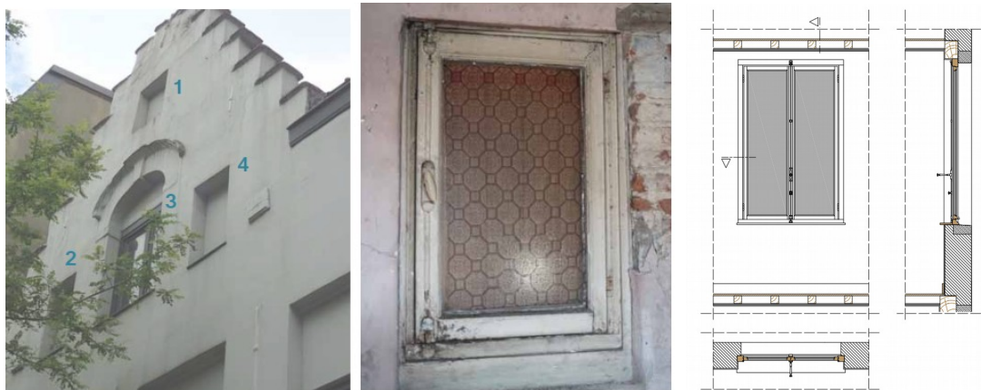
Ci-dessus : vue sur les châssis des combles condamnés à l'extérieur et vue intérieure d'un de ces châssis. A droite, un exemple de modèle type. Le modèle final sera proposé après le relevé des châssis existants. Images tirées du dossier.