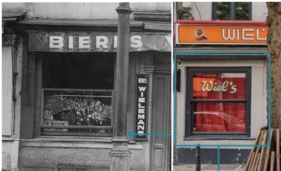
Ci-dessus : Photo de 1953 montrant des pièces de bois encadrant les vitrines et photo actuelle montrant les renforts actuels, supposé en bois et recouvert de plusieurs couches d'enduits. Images tirées du dossier.