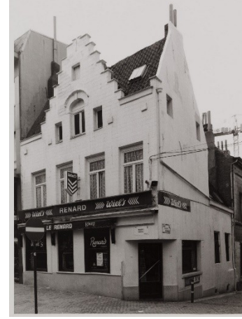
Vue en 1953 après réalisation des travaux.

L'établissement est racheté par la compagnie Wielemans-Ceuppens en 1929 et est doté d'une porte d'accès latérale et c'est suite à un permis délivré en 1953 que le bien prendra sa configuration actuelle : l'accès par la porte latérale et la devanture principale sont remplacés par des fenêtres et un pan-coupé avec porte d'entrée est créé à l'angle du bâtiment. Les façades présentent un enduit lisse peint. Dans les années '80 les fenêtres du 1 er étage sont remplacées et les impostes sont rendues aveugles.