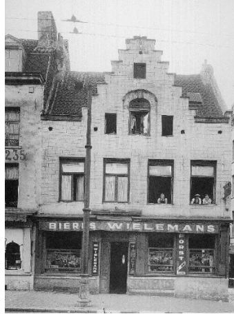
Vue en 1940. ©KIK-IRPA. Cliché AO75287