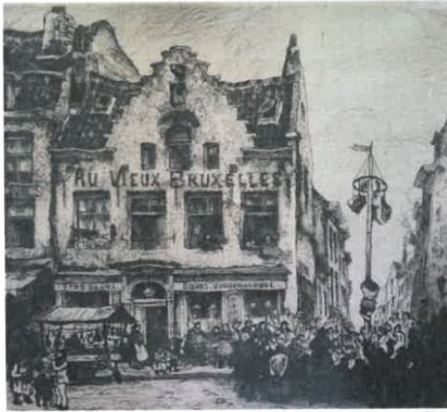
« Au Vieux Bruxelles », eau-forte de Jef Cordon (1900)

Après avoir abrité une pension et des commerces, le rez-de-chaussée est occupé par un café à partir de 1900, comme en témoigne une eau forte d'époque, fonction qu'il occupe toujours actuellement.