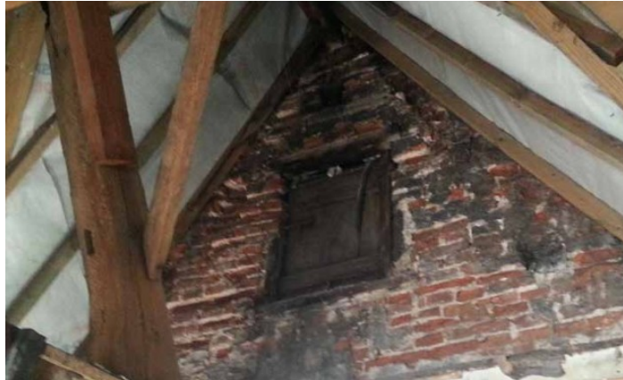
Ci-dessus : Photo d'un des châssis condamnés et vue sur la charpente dont certains éléments seront remplacés après études. Image tirée du dossier.