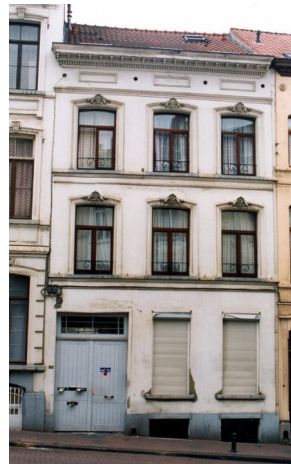
Enfilade néoclassique de la rue de l'Eglise de Saint-Gilles Façade à rue du n°53

La demande porte sur le réaménagement et l'agrandissement du duplex des 3 e et 4 e étages de la maison avec une importante surhausse de la toiture. Pour mémoire, un permis a déjà été délivré pour un premier projet de réaménagement du duplex avec une augmentation du volume de la toiture mais uniquement du côté arrière. Ce premier projet n'a pas été réalisé.