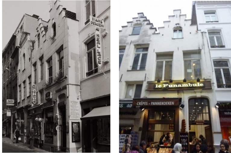
Rue de l'Etuve, 42 - vues en 1980 et actuelle

Actuellement, la maison est affectée au commerce (caves et rez-de-chaussée) et au logement (duplex au R+1 et combles). Vu l'étroitesse de la maison, l'accès unique et les besoins liés au commerce, la demande porte sur la régularisation d'un changement d'affectation, à savoir l'extension du commerce aux étages et la suppression du logement. Le 1 er étage est utilisé par les divers employés comme vestiaire, réfectoire et lieu de repos et un bureau occupe les combles. Il n'y a pas de travaux structurels liés à ce changement d'affectation.