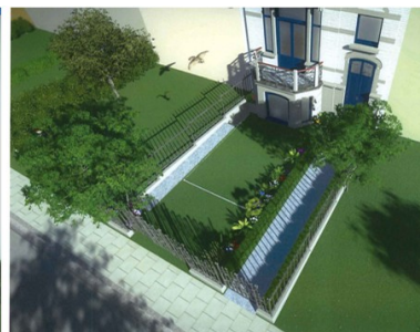
VUE 3a AVEC ZONE DE REcul TRANSFORMEE EN JARDIN