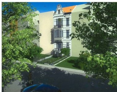
VUE 1a AVEC ZONE DE REcul TRANSFORMEE EN JARDIN