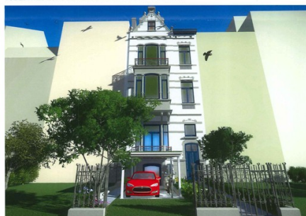
VUE 2b AVEC ASCENSEUR A ENGINs ELECTRIQUES REMONTES