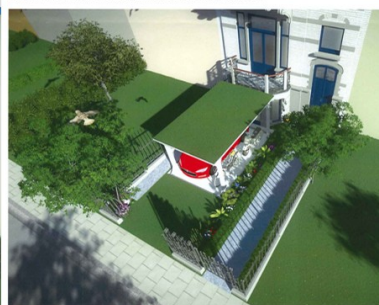
VUE 3b AVEC ASCENSEUR A ENGINs ELECTRIQUES REMONTES