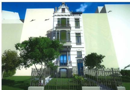
VUE 2a AVEC ZONE DE REcul TRANSFORMEE EN JARDIN