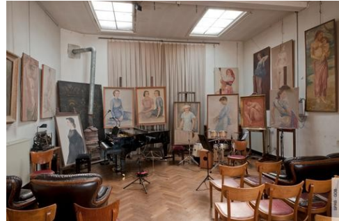
Façade, cour intérieur et atelier / salle de concert de la maison Hastir

Cette maison compte parmi les rares constructions d'origine qui subsistent du quartier Léopold. Probablement réalisée entre 1844 et 1858, il s'agit d'une des premières représentantes de la typologie de la maison traditionnelle bruxelloise.