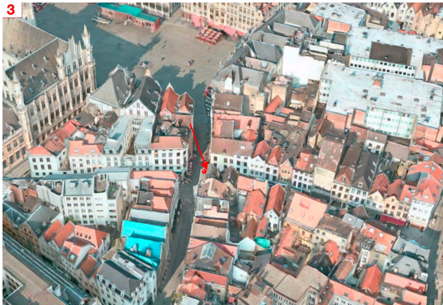
Extr. de la demande de permis

Ces deux maisons font partie de l'ensemble classé (AG 13/12/2001) comprenant les façades à rue et arrières, les toitures, les structures portantes, les charpentes, les caves ainsi que certains éléments intérieurs (planchers et couvrements de sol anciens, cages d'escalier et cheminée ancienne) des maisons sises 1, 3-3A, 11, 22 et 24, rue du Marché aux Fromages.