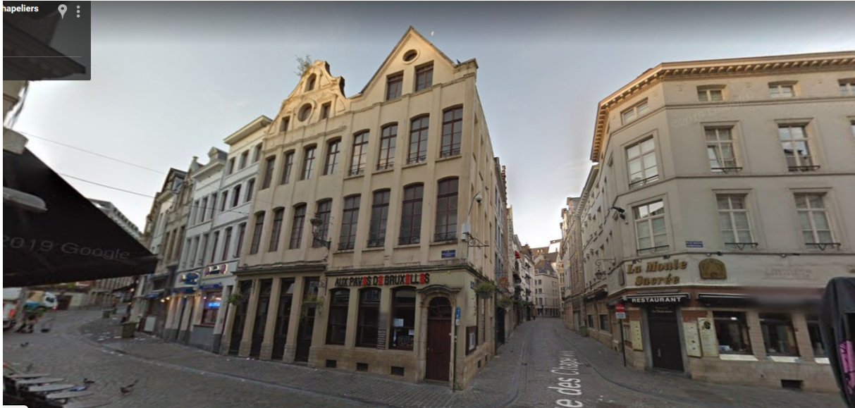
Angle des rues du Marché aux Fromages et des Chapeliers

Marché aux Fromages et des Chapeliers, ils se situent en outre dans l'une des perspectives visibles depuis la Grand-Place.