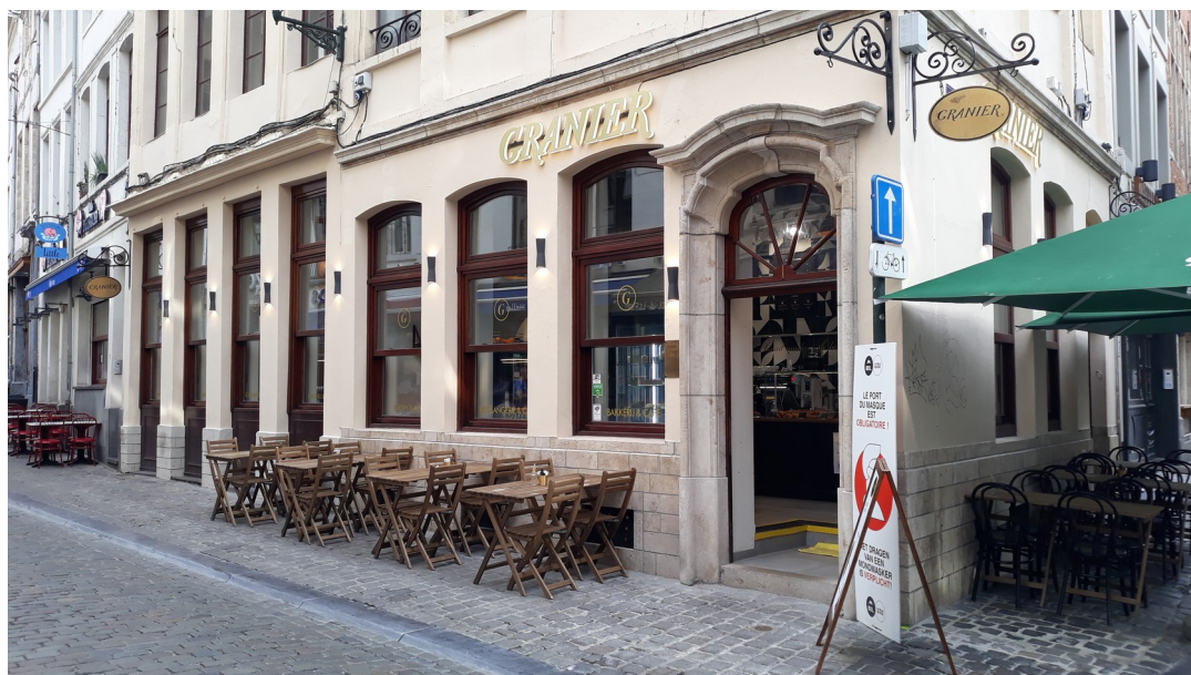
Vue réalisée