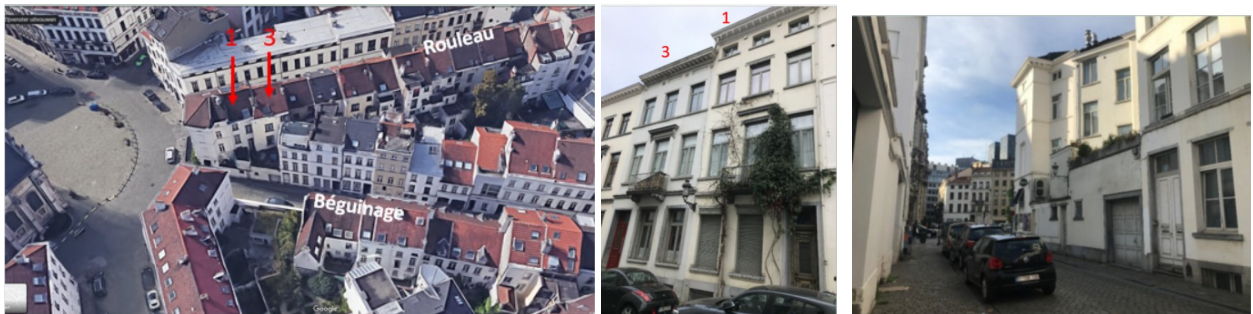
Implantation des maisons et vue sur les façades depuis la rue du Rouleau et la rue du Béguinage

Les deux maisons concernées par la demande sont inscrites à l'Inventaire du patrimoine architectural de Bruxelles. Elles sont comprises dans la zone de protection de l'ensemble classé formé par les maisons du Béguinage, et se situent à proximité directe de l'église Saint-Jean Baptiste au Béguinage, classé comme monument.