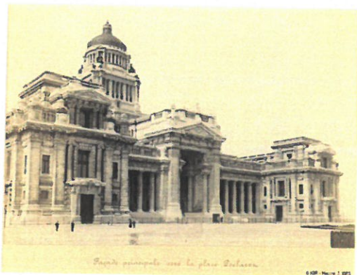
Justitiepaleis in 1883 met recht hekwerk op het voorplein Illustratie uit het dossier

De vormgeving van het hekwerk volgt deze van het vroegere hekwerk en is gebaseerd op historische documenten.