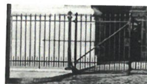
Detail van het historische hekwerk

De vormgeving van het hekwerk volgt deze van het vroegere hekwerk en is gebaseerd op historische documenten.