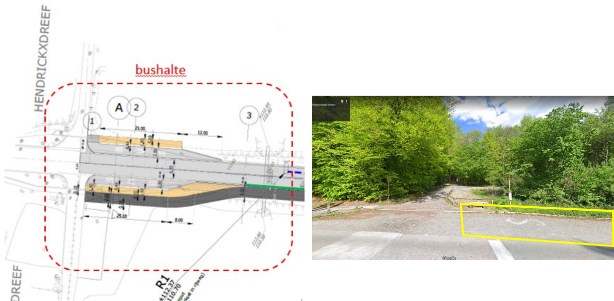
Ontwerpplan van de bushaltes gevoegd bij de aanvraag / Interventiezone ter hoogte van de Hendrickxdreef

Globaal genomen staat de Commissie erg positief tegenover het voorliggende totaalproject. De herinrichting van de steenweg en de verbreding van het dubbelrichtingsfietspad vormen een pluspunt. Ze zullen bijdragen tot meer veiligheid voor de weggebruikers zonder te raken aan de erfgoedwaarde van het beschermde Zoniënwoud. De Commissie hoopt dan ook dat de versmalling van de rijweg in een latere fase wordt doorgetrokken in de richting van het Brussels Gewest. Ook de voorziene afwatering van het vervuilde regenwater is gunstig voor het aanpalende beschermde natuurgebied.