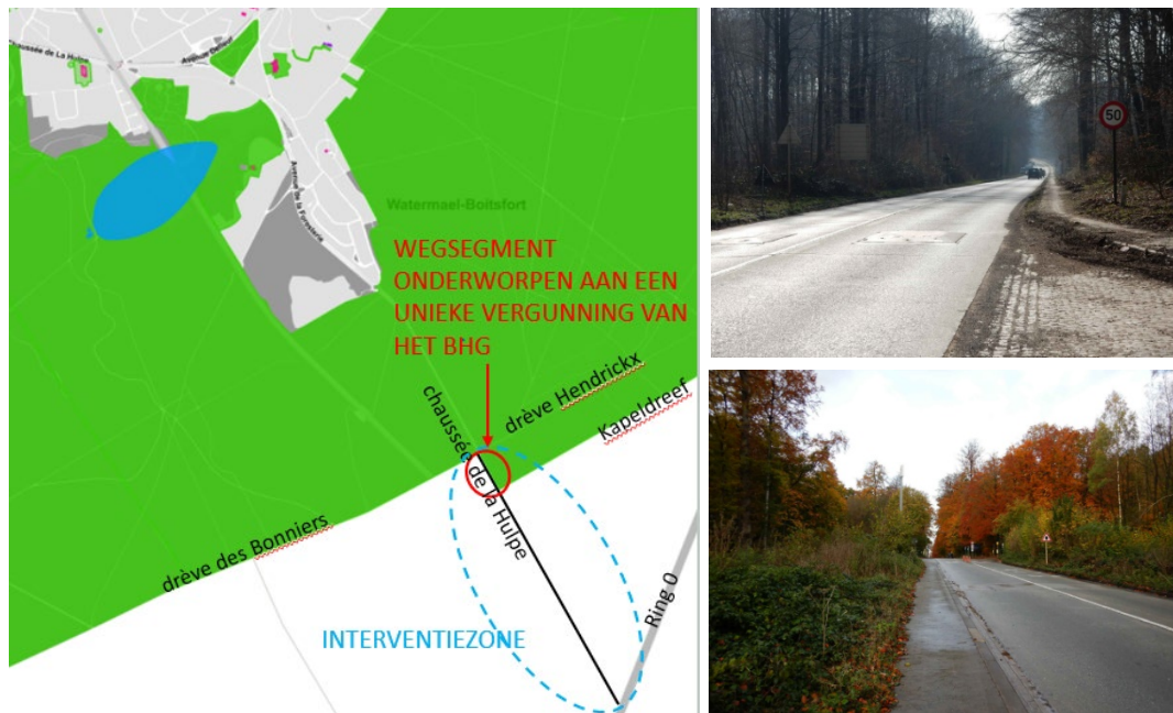
Afbakening van de perimeter en bestaand profiel van de Terhulpesteenweg

bijgevolg het voorwerp uit van een aanvraag tot unieke vergunning, ingediend bij de overheid van het Brussels Gewest.