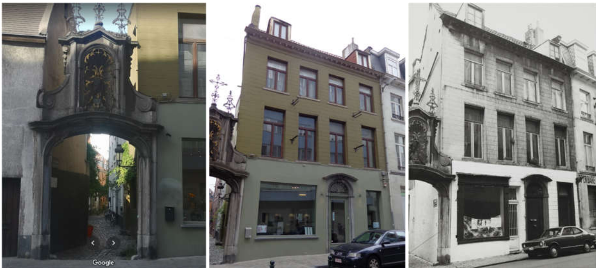
La porte Saint-Roch et la maison qui lui est accolée

Actuellement, il est demandé de régulariser des travaux réalisés en infraction (procès-verbal dressé en date du 11/12/2017 – réf. NOVA 04/INFS/659952), qui consistent en la mise en peinture des façades avant et latérale dans une couleur vert-olive. L'intervention suivante est également projetée dans la présente demande : réalisation d'un conduit d'évacuation commun pour récolter les évacuations des chaudières individuelles le long de la façade dans la rue de la Cigogne, en lieu et place de plusieurs conduits individuels.