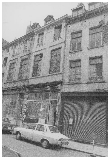
Vue des n° 15 & 17 en 1975.