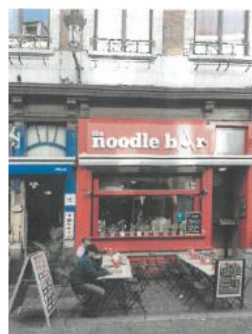
Vue du n° 15, post juillet 2020 avec les insertions accomplies.

La demande vise la régularisation des différentes interventions réalisées sans autorisation, plus spécifiquement l'obturation de la vitrine commerciale par un panneau de bois peint en rouge portant l'inscription « The Noodle Bar » en lettres blanches, la mise en peinture de la devanture, de la porte d'accès au commerce et du soupirail métallique ainsi que la pose d'un caisson à volet noir.