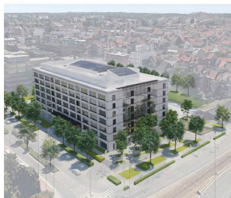
Luchtfoto en fotomontage uit het aanvraagdossier