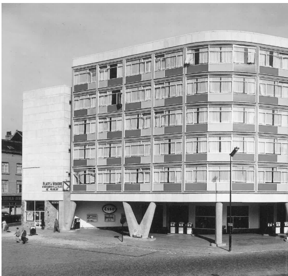
Photo de 1959 extrait de S. Van de Voorde et T. Bonivar, 2012, p.6.

La proposition de classement comme monument, émanant du Collège des Bourgmestre et Echevins de la Commune de Saint-Josse-ten-Noode, porte sur l'immeuble situé à l'angle de la Place Saint-Lazare n°1 et de la rue de la rivière. L'immeuble fut construit en 1957 par l'architecte Claude Laurens pour accueillir un hôtel et, au rez-de-chaussée ouvert, une station de service de type 'drive-in'. Peu de temps après sa construction, il a vraisemblablement été affecté à du logement plutôt que la fonction hôtelière initiale. Le rez-de-chaussée a été fermé de manière peu qualitative à une époque inconnue. La façade aveugle, située à l'angle avec la rue de la Rivière a récemment été couverte d'une peinture murale. L'immeuble est repris à l'inventaire du patrimoine architectural de la Région.