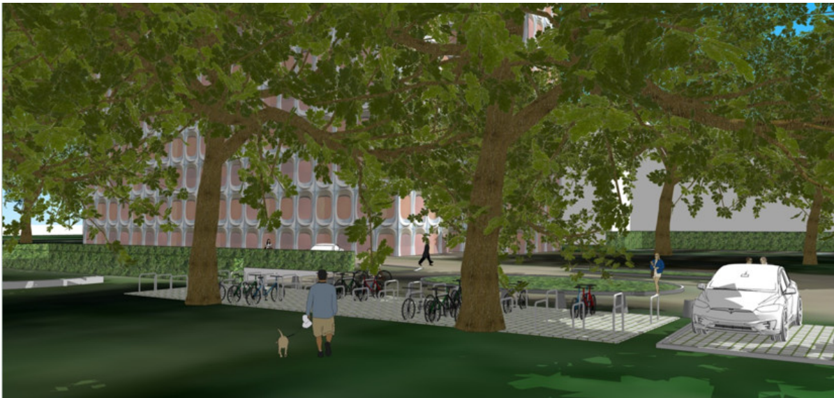
Infographie jointe à la demande

Cette zone est envisagée comme une extension des emplacements pour autos situés à proximité de la rampe de parking. Elle serait quasi totalement implantée sous deux platanes centenaires, ce qui n'est pas satisfaisant sur le plan paysager. La mise en œuvre de revêtements en béton-gazon (autour des troncs) et d'arceaux ancrés dans le sol, est en outre un aménagement inadapté au système racinaire des arbres. Sans s'opposer à la présence d'un parking pour vélos, la Commission recommande de poursuivre la réflexion sur l'implantation et la matérialisation du dispositif. Elle recommande d'examiner la possibilité d'occuper l'un des emplacements actuellement réservés aux voitures sur une des trois zones de parking existantes. Ce serait là un bon signal, et une option soucieuse du respect du site, que de donner la place au vélo, là où, plus tôt, c'était celle de la voiture. Dans tous les cas, l'implantation définitive sera choisie en fonction d'une intégration paysagère optimale.