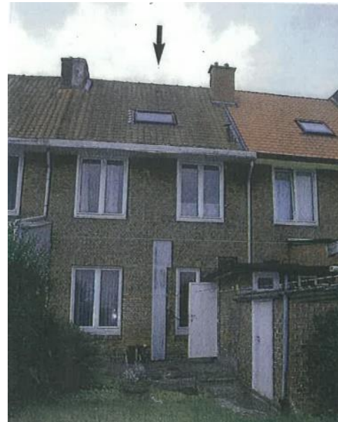
A droite : photo de la façade arrière des châssis à remplacer et de la fenêtre de toit. L'abri de jardin est visible à droite au premier plan. Images tirées du dossier de demande.