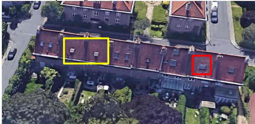
Ci-dessus : vue aérienne annotée par la CRMS des toitures arrières du bloc de maison. En jaune, les fenêtres conformes au plan de gestion, en rouge la fenêtre visée par la présente demande.