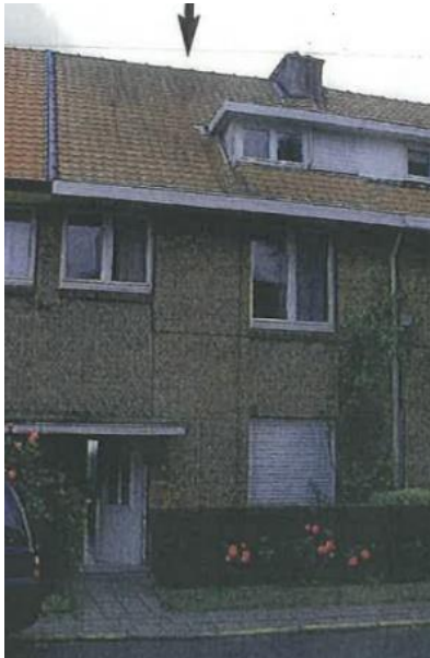
A gauche : photo de la façade avant et des châssis à remplacer.