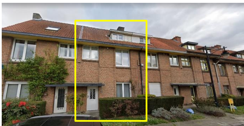
Vue du bien depuis la rue des Pyrèthres.

La maison sise Rue des pyrèthres n°13 se situe dans la cité « Floréal » et fait partie de la catégorie des maisons « jaunes ». Les plans d'origines sont datés de 1928 et sont l'œuvre de l'architecte J-J. Eggericx. Une annexe a été construite en façade arrière dans les années '60 (WC) et l'ensemble des châssis en bois furent remplacés dans les années '80 par des châssis en PVC sans respect de la composition du bien. En 2004, une demande de permis est introduite pour créer une porte-fenêtre donnant accès au jardin en façade arrière, en remplacement d'une fenêtre (permis délivré 17/PFU/159479).