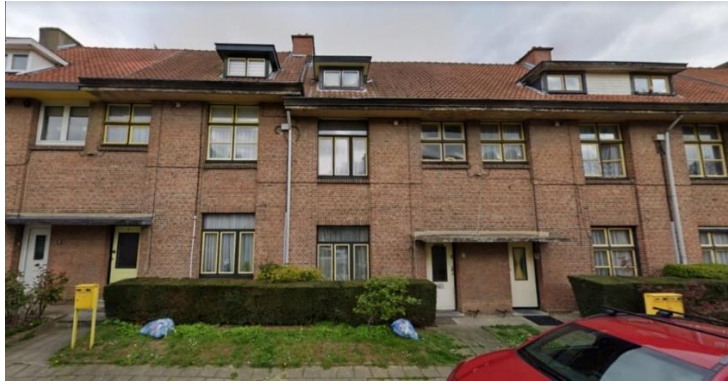
Ci-dessus : Image des numéros 5-9 de la même rue présentant des portes et lucarnes peint en cohérence avec les châssis conforme au plan de gestion.