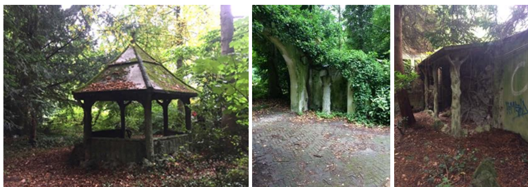
Vues de la propriété

Suite aux remarques du Collège des Bourgmestre et Echevins de la Commune d’Uccle, évoquant pour cette zone les prescriptions de « zone d’habitat en ordre ouvert » du PPAS 51 « Floride-Langeveld », il est également question – dans ce même arrêté d’entame de classement du 06/06/2019 – d’une réduction de l’emprise initiale proposée au classement, à savoir la suppression de la partie Nord de la parcelle 215K5, ce qui semble correspondre à l’ancien potager (vestiges des serres et dépendance). L’emprise actuelle de la proposition de classement est précisée dans le plan ci-dessous.