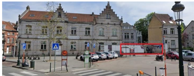
Vue sur l'académie de dessin et le mur, entouré de rouge, sur lequel seront installés les panneaux. Avril 2019.

La demande est introduite par la Commune dans le cadre de son engagement contre les violences faites aux femmes. Elle porte sur création d'un lieu d'expression artistique sous forme de peintures et de dessins, sur le mur de l'Académie longeant la place Andrée Payfa-Fosséprez. Pour ce faire, plusieurs panneaux de bois sont fixés sur les trois surfaces rectangulaires en saillies du mur de briques. Ces derniers sont maintenus par quatre percements dans les joints entre les briques, tout en laissant visibles les cabochons de pierre dans les coins, l'ensemble formant ainsi un cadre. Les œuvres artistiques seront réalisées sur ces panneaux au rythme de quatre œuvres par an.