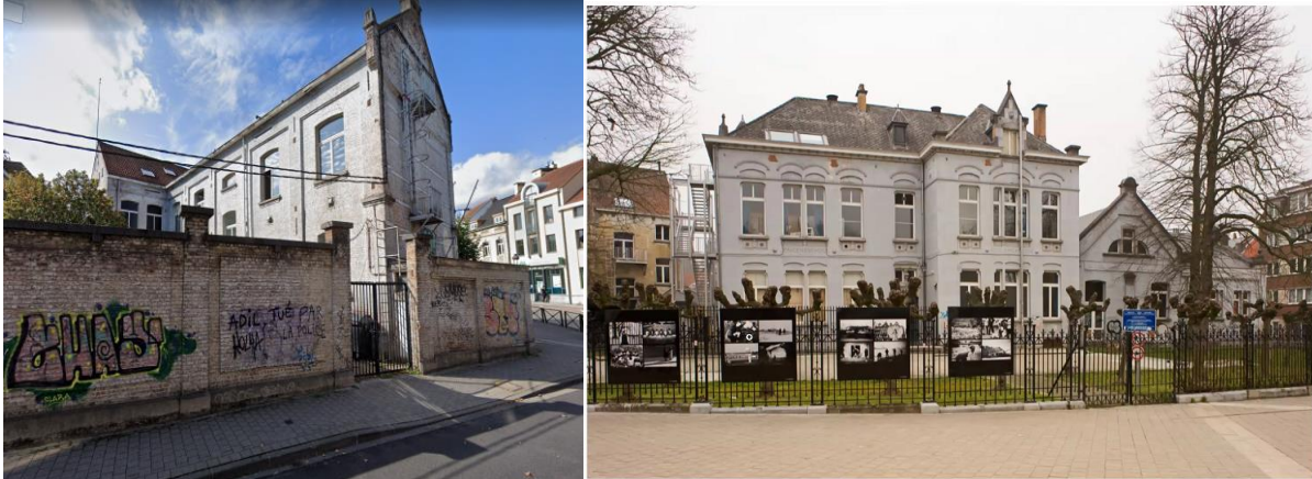
A gauche : vue sur le mur de clôture, tagué, Rue Major Brück.

De manière générale, la CRMS recommande d'accorder l'attention et le soin qu'elle mérite à l'ensemble de l'académie et ses murs de pourtour, relevant e.a. l'état détérioré du mur côté rue Major Brück et l'intégration moins réussie (que dans l'objet de la demande) des productions artistiques accrochées aux grilles en fer forgé face au « Skate Park ».