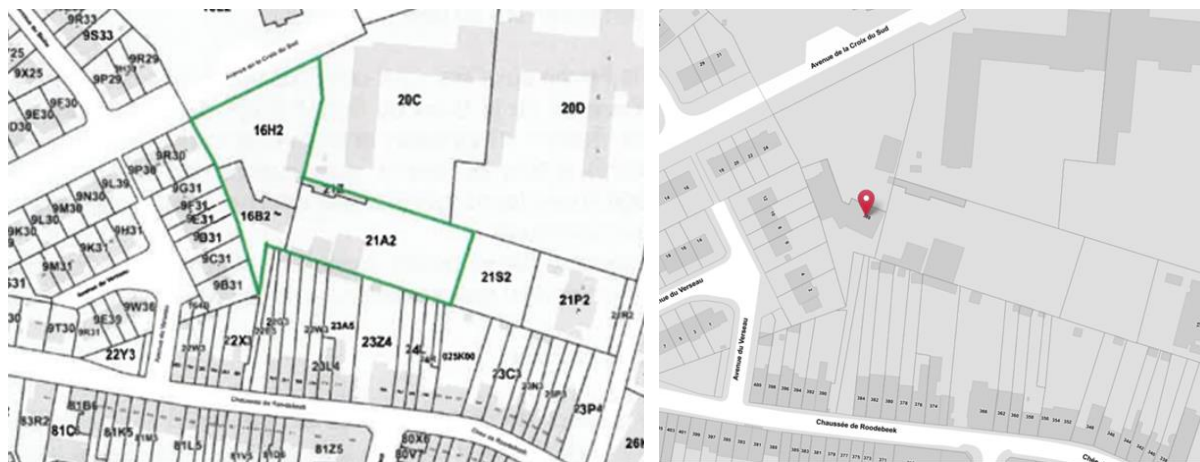
Plan encadré en vert des parcelles composant le site (extr. de la demande) et extr. de Brugis

Compris entre la chaussée de Roodebeek et l'avenue de la Croix du Sud, le site est une ancienne propriété agricole composée d'une maison d'habitation entourée de dépendances liées à l'exploitation (hangars, étables, fournil), de pâtures et d'un verger. L'ensemble, à l'abandon actuellement et devenu propriété d'une société immobilière, s'étend sur environ 60 ares (parcelles 16H2, 16B2, 21A2 et 21Z).