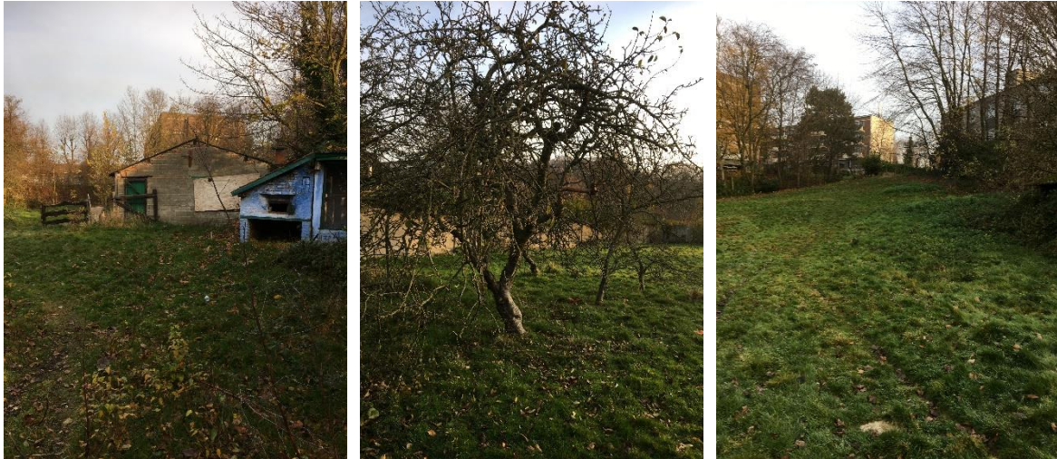
Vues diverses du site, de l'ancienne habitation et des quelques dépendances