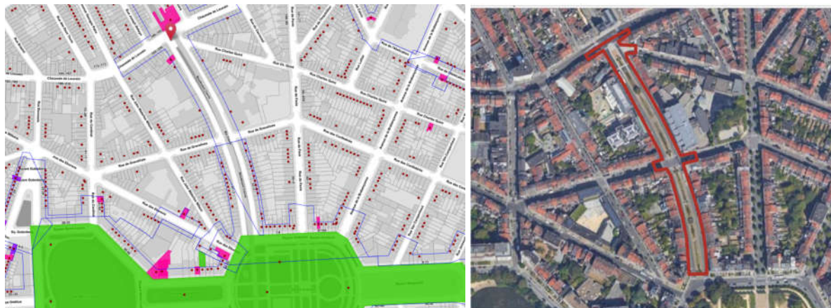
extr. de Brugis et du dossier de demande

Le boulevard Clovis, repris en espace structurant et en ZICHEE au PRAS, comprend la « Maison Van Dijck » (n°85) classée comme monument. L'ensemble du boulevard se situe dans la zone de protection soit de l'ancienne gare de St-Josse-ten-Node classée comme monument, soit des squares Ambiorix, Marie-Louise et Marguerite classés comme site avec l'avenue Palmerston. Plusieurs biens sont inscrits à l'Inventaire du Patrimoine architectural de la Région de Bruxelles-capitale.