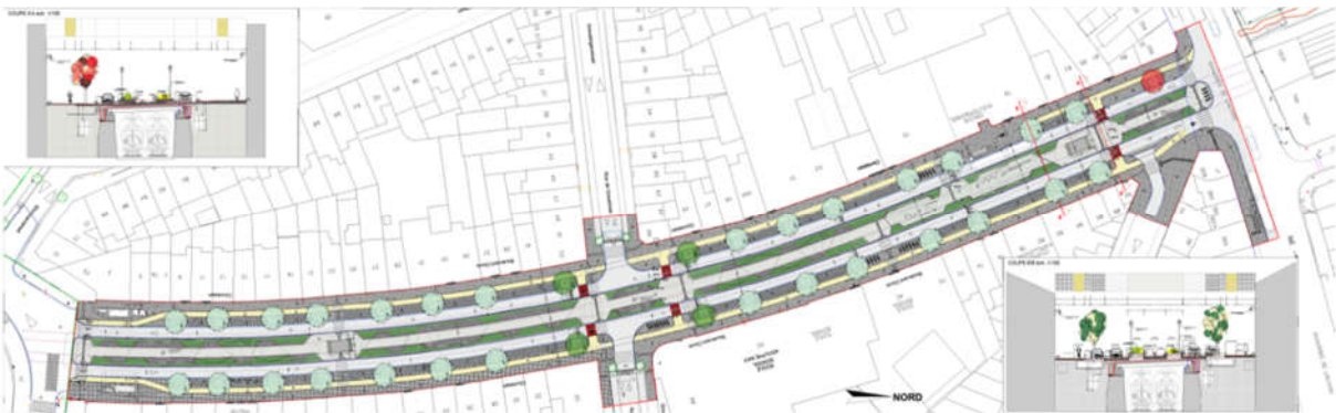
Plan et coupes projetés (extr. du dossier de demande)