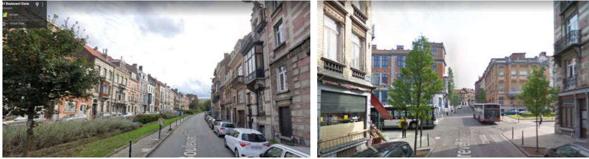
Situation du boulevard avant le début des travaux, en 2019 et vue du carrefour Clovis-Gravelines en 2009