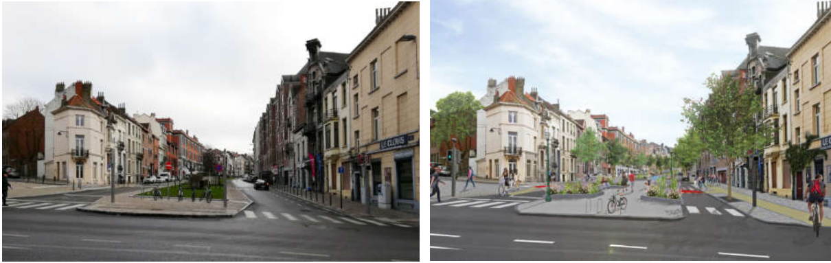
Situation en 2019 et situation projetée