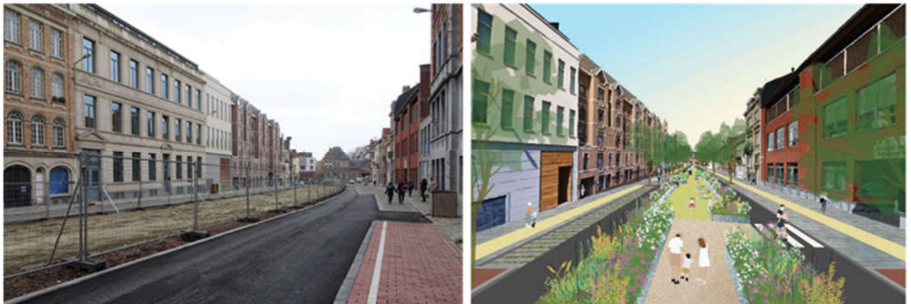
Vue du boulevard Clovis en décembre 2020 (©arau) et esquisse du projet de réaménagement du boulevard (extr. du dossier de demande)

La demande s'inscrit dans le contexte du renouvellement des tabliers d'une partie du tunnel ferroviaire « Berlaymont » (ligne 161, Bruxelles-Namur), à hauteur du boulevard Clovis, n os 2 à 85, ainsi que l'aménagement de deux issues de secours. Pour rappel, ce grand chantier mené par Infrabel avait fait l'objet d'un avis de la CRMS en sa séance du 22/08/2018, dans lequel elle insistait « pour que les travaux s'accompagnent d'une remise en état soignée de l'espace public, à l'identique de l'existant et la mieux intégrée possible eu égard au contexte patrimonial et paysager environnant (zones de protection, Zichee, axe structurant). Les dispositifs techniques indispensables devront être sobres, discrets et parfaitement intégrés ». Ces travaux d'envergure ont commencé fin 2019 et se sont terminés fin 2020 avec le réasphaltage de la voirie.