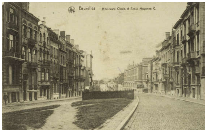
Vue du boulevard Clovis vers la chaussée de Louvain (Collection de Dexia Banque, s.d.).

A dr. le boulevard Clovis en 2007. ( https://monument.heritage.brussels/fr/streets/10005027 )