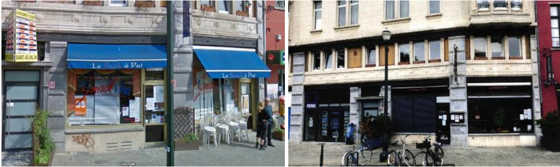
Ci-dessus : vue sur le rez-de-chaussée commercial en 2009 et en 2020