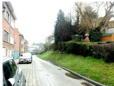
Vue de l'avenue du Pré des Agneaux illustrant le talus des habitations de la cité Floréal

Pour rappel, la CRMS ne s'est pas prononcée sur la demande initiale du 16/01/2019 qui visait la démolition d'un garage existant, l'abattage d'un arbre et la construction de 7 logements. La Commission de concertation a émis un avis unanime défavorable le 31/01/2019. Le projet a ensuite été revu et modifié pour répondre aux remarques de la concertation et réduire le nombre de dérogations demandées. La nouvelle