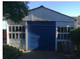
Vue du hangar à démolir