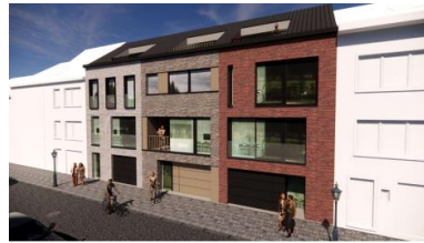
2021 (Extraits du dossier)