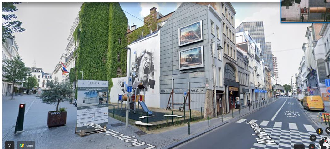
Pignon 29-31 rue du Fossé aux Loups : état existant © Google Earth ; en haut à droite, photomontage joint à la demande