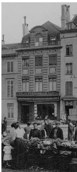
cliché A003483 daté 1895

L'avis conforme de la CRMS, rendu en séance du 13/09/2018, et requis dans le cadre du permis précité mentionnait (à l'appui des illustrations ci-contre) ceci au sujet du traitement de ces châssis « Considérant les photos d'archives (photo AVB début XXème – cf étude historique), d'après l'analyse de la DMS, les châssis de la façade avant étaient vernis (ou peints en imitation bois). Or, c'est une peinture monochrome qui est décrite dans le cahier des charges. Les études et